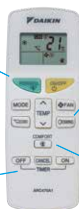
Afstandsbediening voor FTXB20-35C

Hiermee kunt u het toestel programmeren, inclusief de aan/uit- en nachtmodus*. *1 uur na activering van de nachtmodus wordt de instelwaarde verhoogd bij koelen of verlaagd bij verwarmen om comfortabele slaapomstandigheden te garanderen